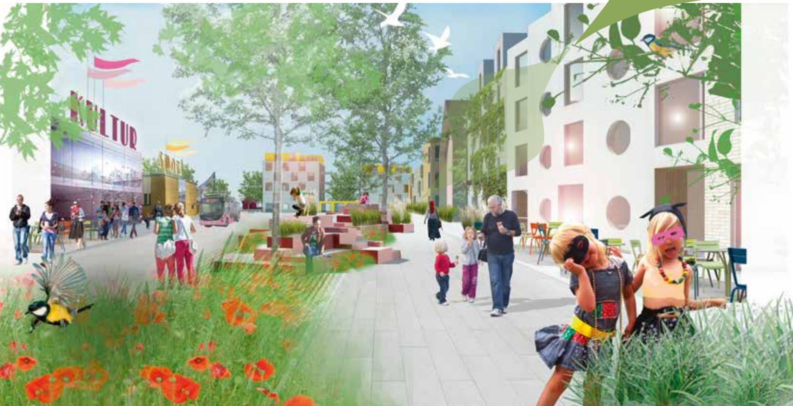
Visionsbild på nya Allaktivitetstorget i hjärtat av Skäggetorp. Illustration Nyréns Arkitektkontor.