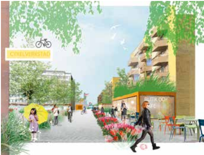
Visionsbild som visar nytt stråk förbi Skäggetorp centrum. Illustration Nyréns Arkitektkontor.

”Det viktigaste är att detta arbete leder till integration”