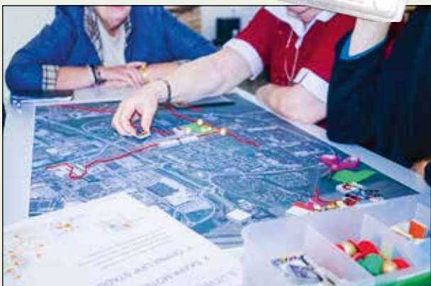
Bilder från tidigare medborgardialog i Skäggetorp våren 2016.