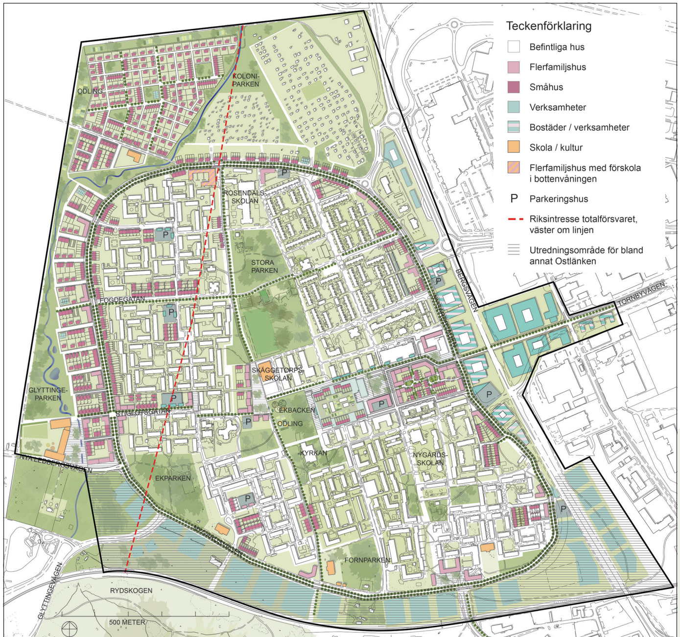
Programförslaget visar utvecklingen av stadsdelen Skäggetorp. Illustration Nyréns Arkitektkontor.