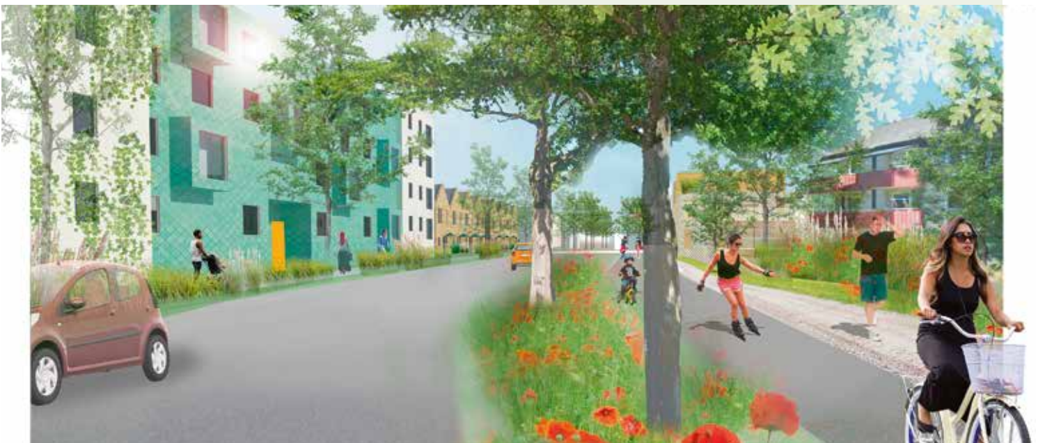
Visionsbild som visar Nygårdsvägens omvandling till stadsgata. Illustration Nyréns Arkitektkontor.