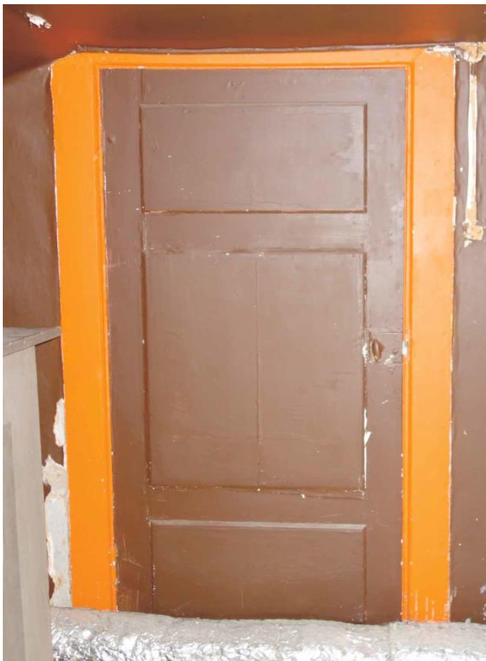
Dörr som kan vara tillverkad under 1700-talet.

Interiört omfattas dörr av skyddsbestämmelse som visar spår på att vara tillverkad under 1700-talet, både vad gäller konstruktion och viss bevarad beslagning. Av allt att döma är dörren omhängd med nya gångjärn och har kompletterats med lås från 1800-talets slut. Dörren är en av få äldre detaljer i byggnaden.