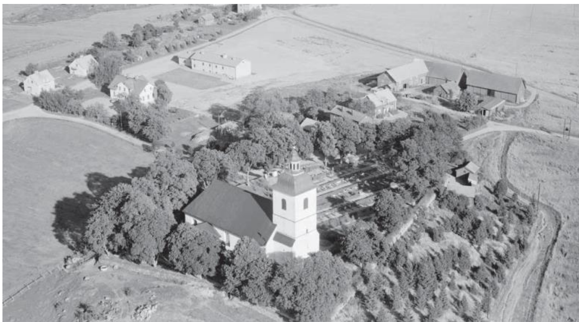
Flygfoto över Bankekind/ Svinstad med kyrka och kringliggande bebyggelse år 1954.

Just Bankekind utveckling gick långsamt ända till mitten av 1900-talet på grund av bristen på industrier men uppvisar i gengäld en tydlig bild av utvecklingen av en småort i en utpräglad odlingsbygd där gårdarna och livsmedelsproduktionen haft störst betydelse. Bankekind fortsatte vara en ganska småskalig ort ända in på 1900-talets andra hälft, men utgjorde bygdens centralort med skola, butik och samhällsservice.