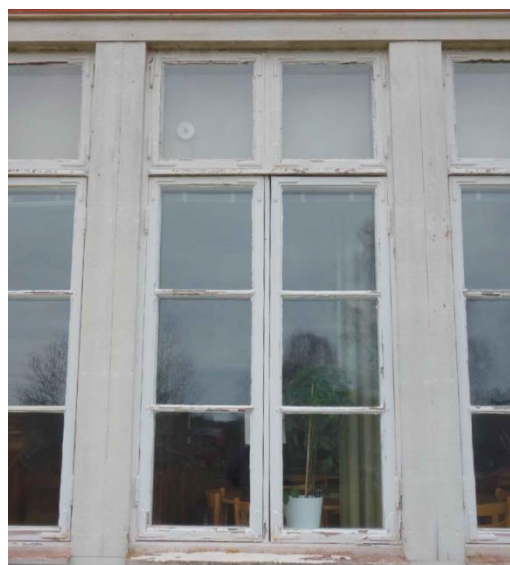
På byggnadens nordöstra fasad är samtliga fönster från 1930-tal och utgör värdebärande karaktärsdrag.