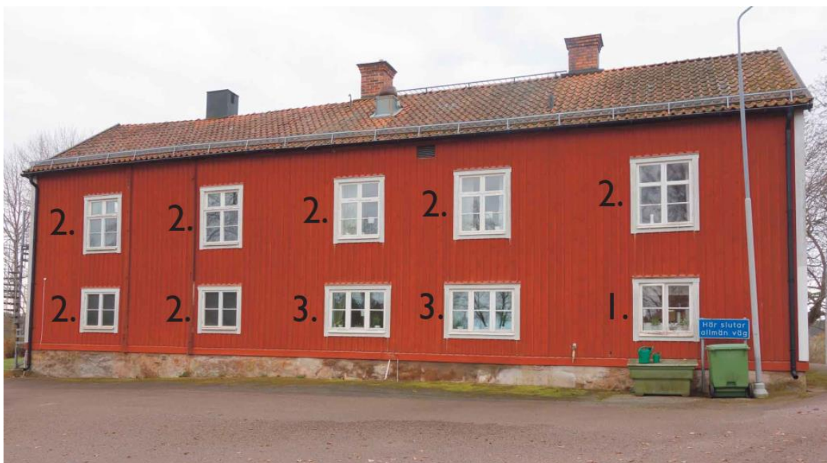
Byggnadens tak, skorstenar och äldre fönster utgör värdebärande karaktärsdrag. Fönster på den nordvästra fasaden från olika tidpunkter, nummer 1 är 1930-tal, nummer 2 är 1980-tal och nummer 3 är 2000-tal.