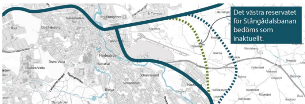
Figur 5: Det västra reservatet för Stångådalsbanan (grön linje) har bedömts som inaktuell utifrån ny kunskap

Värdering av fastigheten Vårdsberg 2:2 har utförts av en extern oberoende värderingsman under sommaren 2023. Överenskommelse har träffats med ägarna om förvärv. Linköpings kommun har för avsikt att reglera fastigheten till kommunens intilliggande fastighet Hackefors 5:1