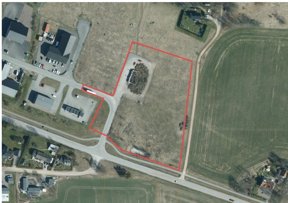
Bilden ovan illustrerar planområdesgränsen i rött.

Markplanering av allmän plats ska anpassas till befintlig grönstruktur i verksamhetsområdet genom att möjliggöra naturlig plantering öster om huvudbyggnaden.