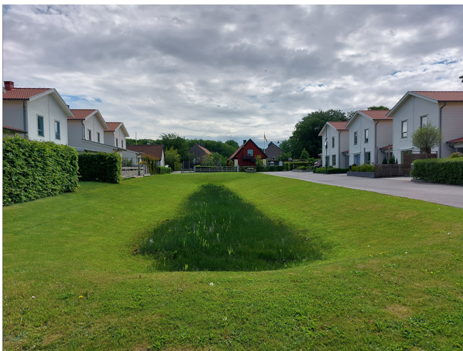
Figur 2. Dagvattenåtgärd (svackdike) i villaområde.

Att ta hand om dagvatten på ett hållbart sätt är viktigt för att minska risken för översvämningar och begränsa spridningen av föroreningar till sjöar och vattendrag. Dagvatten bör ses som en resurs och tas omhand så nära källan som möjligt.