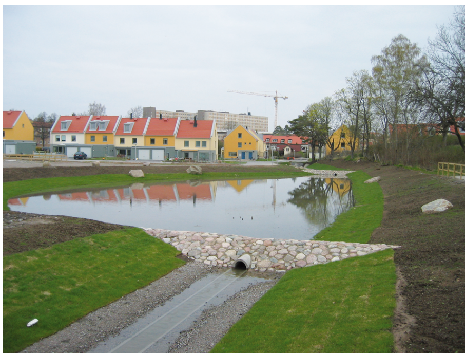
Figur 3. Dagvattenstråk Tinnerbäcksgård

Fastighetsägarens ansvar regleras bland annat i lagen om allmänna vattentjänster och kommunens allmänna VA-bestämmelser (ABVA).