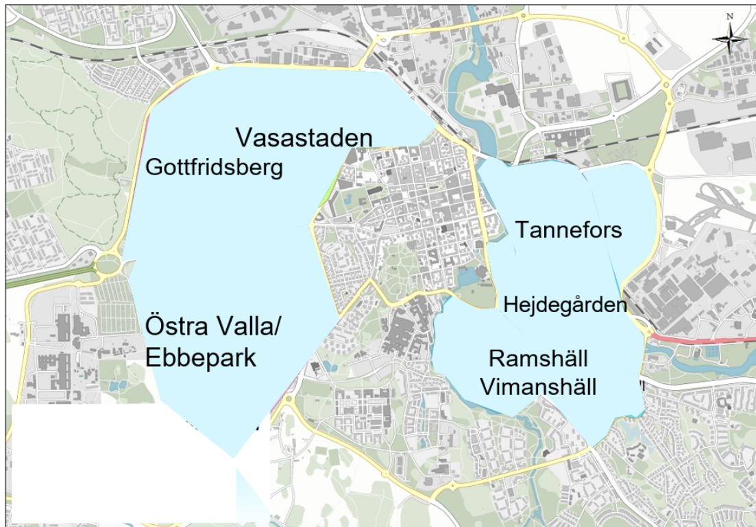
Figur 2 karta zonindelning boendeparkering

I Linköpings kommun är boendeparkering indelat i 7 zoner Vasastaden, Östra Valla/Ebbepark, Gottfridsberg, Hejdegården, Tannefors, Vimanshäll och Ramshäll.