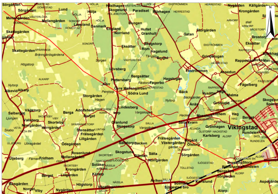
Linjekoncession Döme stad - Vikingstad Linköpings kommun, Östergötlands län