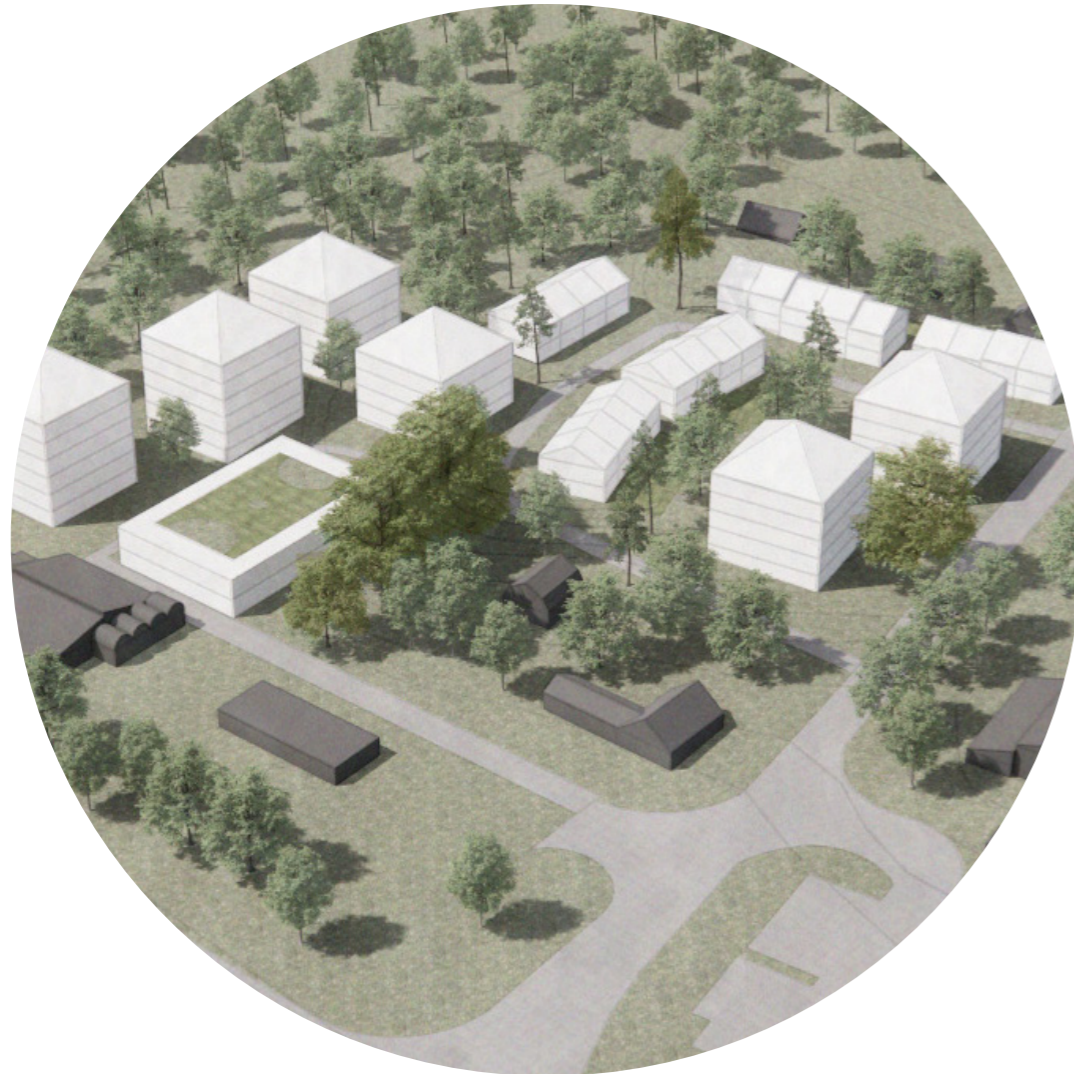
Vy från sydöst