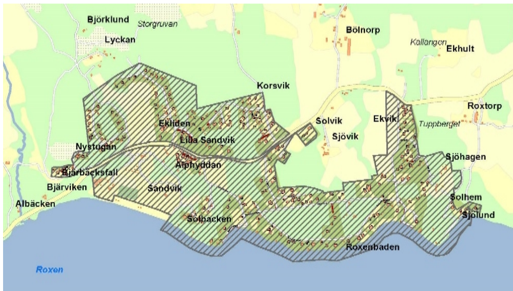
Planområdet för detaljplan för Roxenbaden

Det går inte att förutspå hur ett utfall i mark- och miljööverdomstol skulle kunnat bli, då utfall i liknande ärenden i Sverige varierar och omständigheterna är olika. Miljö- och samhällsbyggnadsförvaltningen har ej kunskap om vilka delar i planen, planens förutsättningar som i domstolens beslut varit avgörande. Dock kan omständigheter som att planen innehåller skola/förskola/centrum, tillskapande av fler nya tomter och stort allmänt motstånd mot enskilt huvudmannaskap varit aspekter som gjort att pendeln vägt över mot kommunalt huvudmannaskap vid domstolens bedömning.