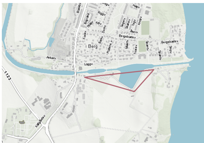
Situationsplan, Berg, aktuellt område schematiskt markera.

Ett nytt detaljplanearbete har också påbörjats för del av fastigheten Kanaljorden 2:1 i syfte att planlägga för ett besökscentrum. Positivt planbesked gavs av SBN 2019-09-11 och beslut om startbesked togs på delegation 2020-10-28.