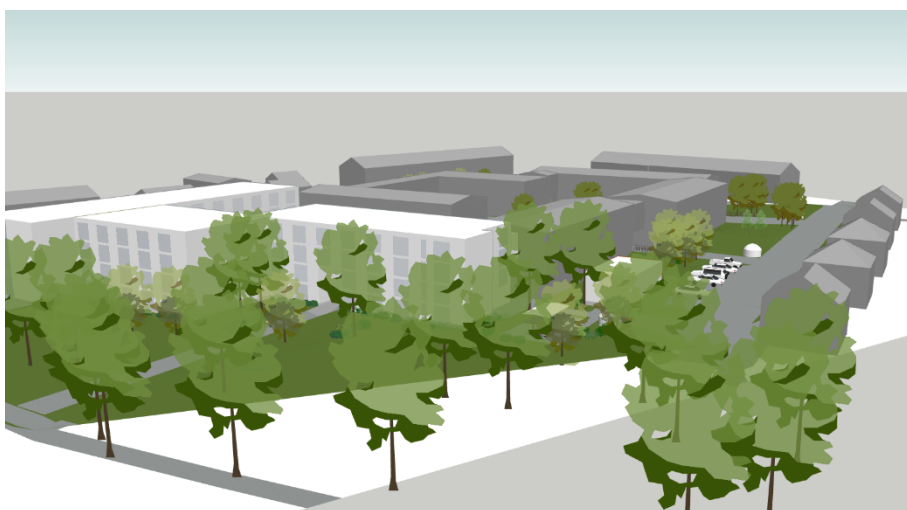
Vy från sydväst, Lektorshagen. Ny bebyggelse illustreras i vitt och befintlig i grått. (M5 arkitektur).