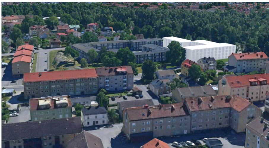
Perspektiv från nordöst.