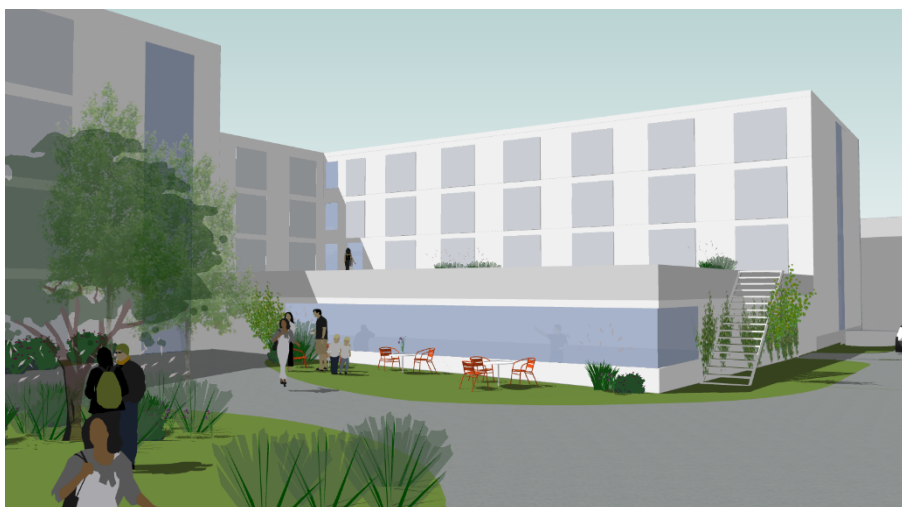
Volymstudie från innergården som möjliggörs i detaljplanen för Flamman 2. Till höger ses garaget där lokaler placeras mot innergården (M5 arkitektur).