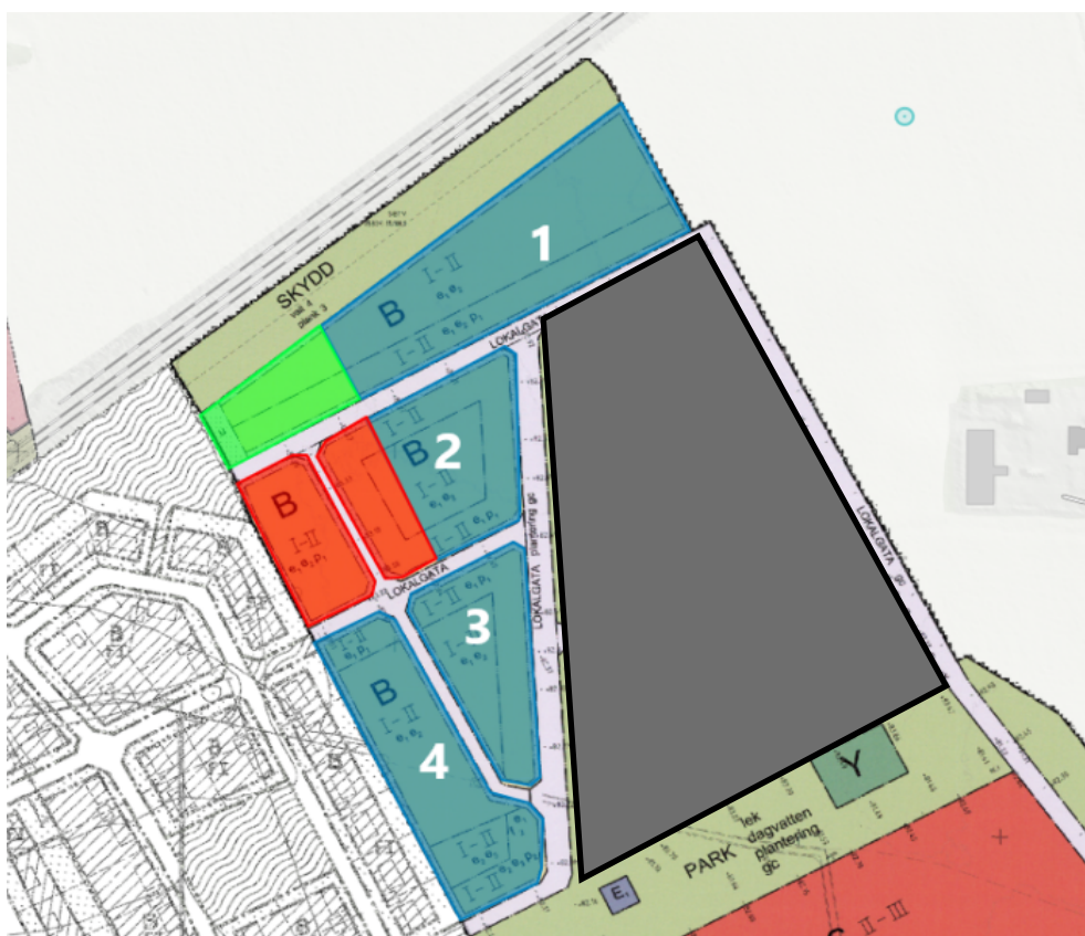
Figur 2 Visar de olika tilldelningsområdena. Röd markering visar plats för småhusbebyggelse. Grön markering visar plats för omsorgsboende. Svart markering visar framtida område för markanvisning.