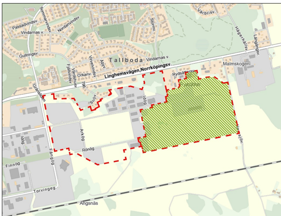
Aktuellt planområde - DP 1474 - illustrerad med grön skraffering. Streckad röd linje utan skraffering representerar intilliggande detaljplan DP 1389, som inte är föremål för ändring.

Samhällsbyggnadsnämnden fattade beslut om positivt planbesked 2017-08-23 samt fattade ett startbeslut 2018-08-22. Förslaget till ändring av detaljplanen har varit ute på samråd 9 oktober – 30 oktober 2019 samt ute på granskning 27 januari – 17 februari 2020. Planhandlingarna har kompletterats efter granskningen. Ändringar och kompletteringar är av redaktionell karaktär.