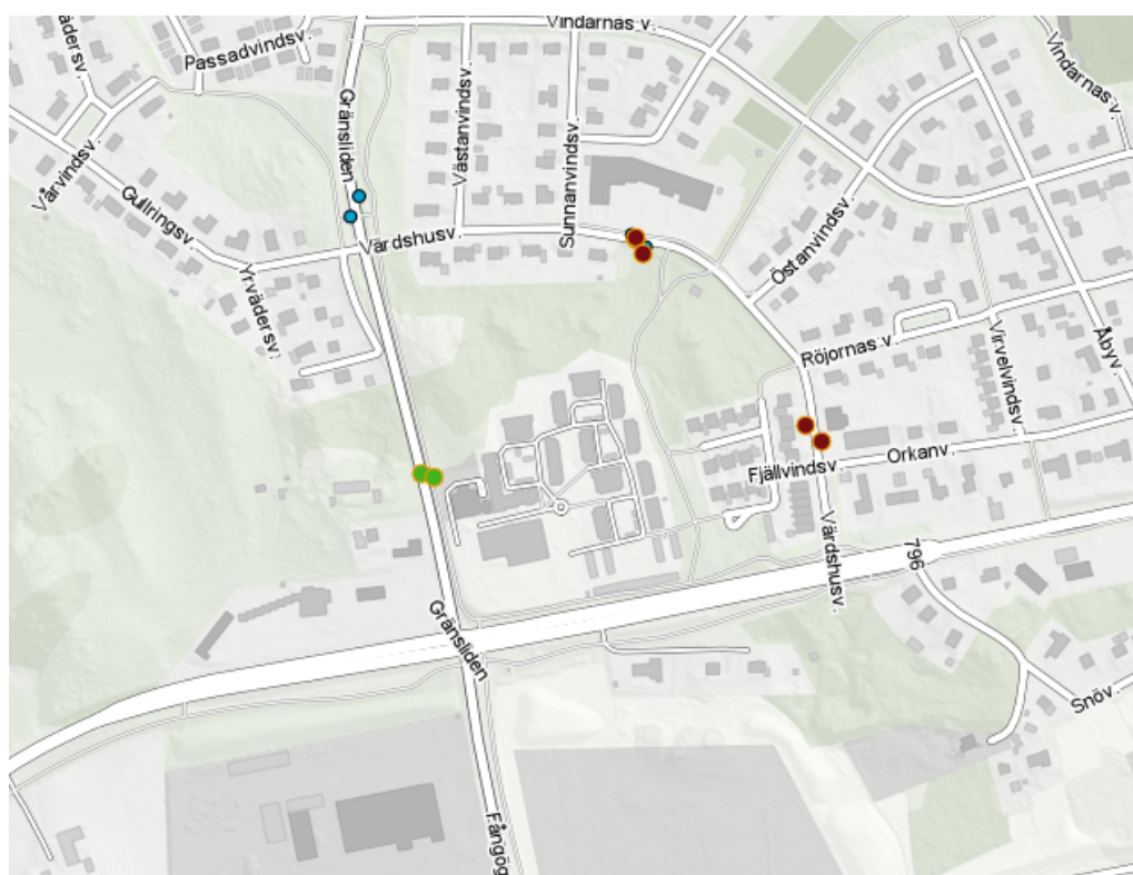
Figur 1 Tallboda, Ny hållplats byggs på gränsliden och två hållplatser på Värdsbusvägen tas bort.