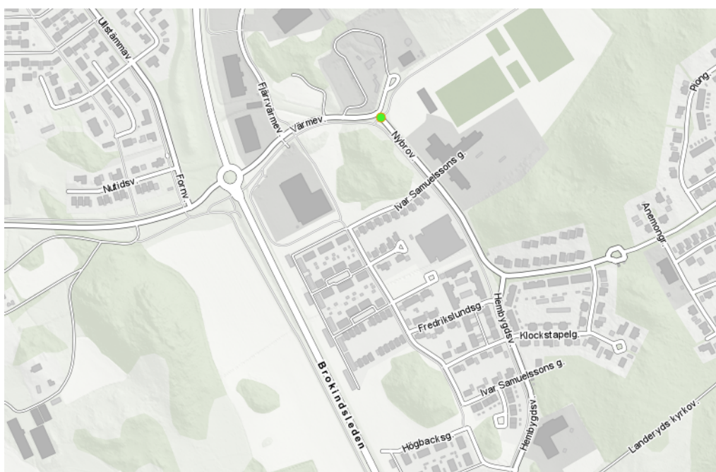
Figur 4 Cykelöverfartens placering Värmevägen/Nybrovägen

I dagsläget är detta en gång- och cykelpassage över Nybrovägen som är en del av skolväg för barn i Ullstämman till Harvestadsskolan. Det finns även en målpunkt till PEMA arena som har aktiviteter både dag- och kvällstid. Cykelvägen öster om Nybrovägen är även huvudcykelstråk. Cykelöverfart och övergångsställe anläggs och en hastighetssäkring till 30 km/h. I Figur 4 visas den gröna pricken den nya cykelöverfarten över Nybrovägen.