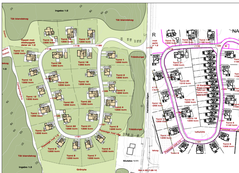
Skisser på möjlig disposition av området (OBOS). Illustrationen till vänster visar endast friliggande småhus. Utsnittet till höger visar halva centrala området med radhus. Skisserna inte är helt aktuella.