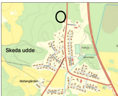
Planområdet i Skeda Udde markerat med svart oval.

Samhällsbyggnadsnämnden fattade beslut i mars 2016 att tillåta en prövning av ny detaljplan för det område som är förenligt med översiktsplanen. Syftet är att pröva möjligheten att uppföra småhus och radhus/kedjehus. Aktuellt område omfattas av Översiktsplan för landsbygden och småorter och är Skeda Udde är utpekad som en landsbygdsort med bra förutsättningar för lokalisering av nya bostäder, kollektivtrafik, servicefunktioner och verksamheter. Detaljplanen följer intentionerna i översiktsplanen. Planområdet är idag obebyggt med inslag av blandskog i kuperad terräng. Planområdet har med sitt perifera läge och sitt lokala höga läge i ett skogsområde, en låg exponering mot Haraldsbovägen och samhället i övrigt. Några preciseringar av gestaltningen av tillkommande bebyggelse har därför inte ansetts vara nödvändig. Detaljplanens bygggrätter kan resultera i ca 25 – 33 nya bostäder beroende på vilken disposition som föredras av exploitören.