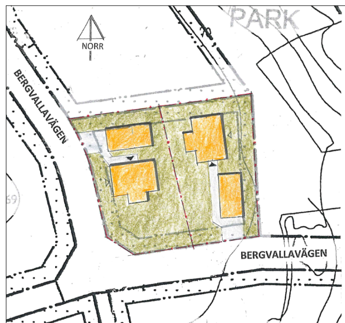
Två förslag på avstyckning samt byggnadsplacering av fastigheten Ullstorp 8:51.