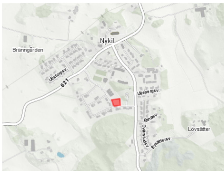
Karta över Nykil. Ullstorp 8:51 är rödmarkerad på kartan.