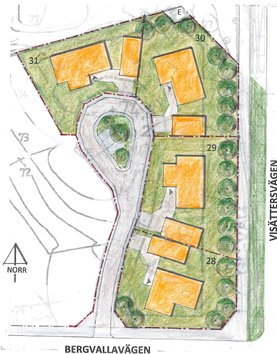
Illustrationsplan med förslag till fastighetsindelning och byggnadsplacering. Fyra stycken tomter.

Den större tomten, Ullstorp 8:51, som ska styckas av till två stycken tomter var tänkt från början för serviceboende. Istället blir det två stycken tomter för friliggande småhusbebyggelse som är planenlig. Detaljplanen godkänner hus med två våningar samt friliggande småhus med minsta tomtstorlek 500 kvm. Största byggnadsarea är 35% av fastighetsarea.