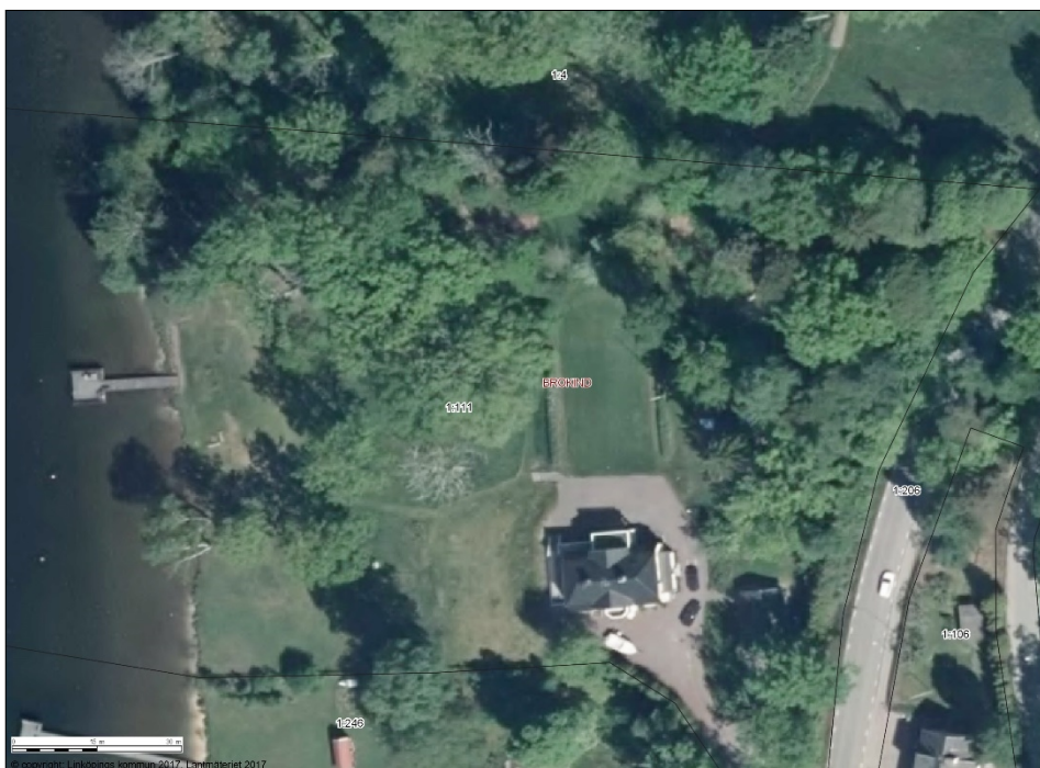
Ortofoto Brokind 1:111.