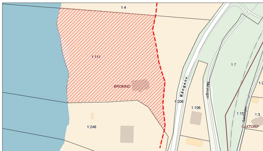
Röd skraffering är strandskyddsområde (100 meter).

Bedömningen är därmed att tillskapandet av en ny byggrätt utanför strandskyddsområdet medför i sin helhet en skada på Riksintresset för Eklandskapet, som inte får anses vara acceptabel.