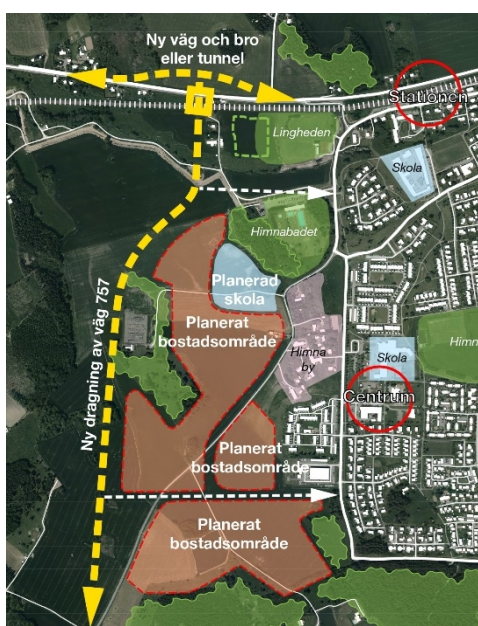
Figur 2. Förslag på förändringar i fördjupad Översiktsplan för Lingham tillsammans med skissad sträckning av anslutning till Lingham och förbifart, väg 757.

Under det inledande arbetet med Trafikverkets vägplan för ny anslutning till Lingham har det identifierats att en del av gällande detaljplan SPL 578 (från år 1974) behöver upphävas, då den inte stämmer överens med den kommande vägplanen. Den aktuella delen av detaljplanen behöver upphävas. En ny detaljplan bedöms inte behöva upprättas.