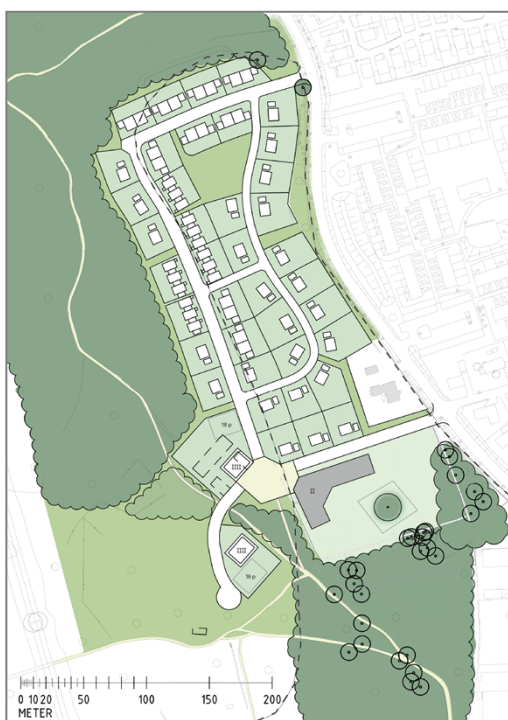
Illustrationskiss från exploatören/Tengbom arkitekter som legat till grund för detaljplanens utformning.

Fastighetsägaren vill bygga ut planområdet med blandad bostadsbebyggelse med övervägande del småhus. Samhällsbyggnadsnämnden fattade beslut om positivt planbesked i december 2014 och startbeslut i december 2015. I dialog med kommunen har en bebyggelsestruktur planerats som även innehåller plats för en skola och allmänna ytor för lek. Det aktuella planområdet sammanfaller i stort med en del av utvecklingsområde C3 i översiktsplanen för Ljungsbro och Berg. Exploatören, tillika markägaren har uttryckt ett långsiktigt intresse av att i framtiden addera ytterligare bebyggelse i etapper in om det i översiktsplanen utpekade området. Denna detaljplan är en första etapp som utformats för att i en framtid kunna kompletteras söderut