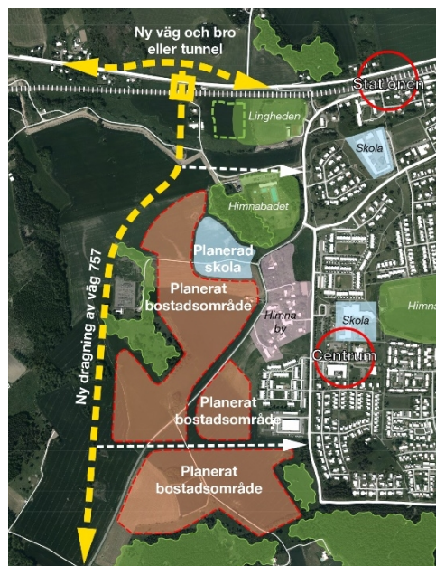
Figur 2. Förslag på förändringar i fördjupad Översiktsplan för Linghem tillsammans med skissad sträckning av anslutning till Linghem och förbifart, väg 757.

Under det inledande arbetet med Trafikverkets vägplan för ny anslutning till Linghem har det identifierats att en del av gällande detaljplan SPL 578 (från år 1974) behöver upphävas, då den inte stämmer överens med den kommande vägplanen. Den aktuella delen av detaljplanen behöver upphävas. En ny detaljplan bedöms inte behöva upprättas.