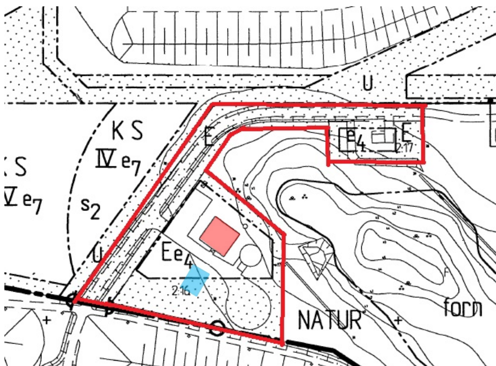
Bild 1: Aktuell detaljplan 1149. Lambohov 2:16 befintlig teleanläggning utmarkerat i rött. Ny teleanläggning markerat i blått.

Gällande detaljplan är DP1149 som vann laga kraft 1993-03-26. I detaljplanen föreskrivs markanvändning teknisk anläggning. Marken där ny byggnad uppförs omfattas av prickmark, mark får ej bebyggas. Sökanden vill därför att gällande detaljplan ska ändras, från att marken inte får bebyggas till markanvändning telekommunikationsanläggning. Syftet med ansökan är att detaljplanen ska överensstämma med befintlig användning, inte att utveckla verksamheten.