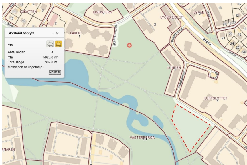
Alternativ Prästbolsgatan, streckad röd yta motsvarar cirka 5000 m 2 .