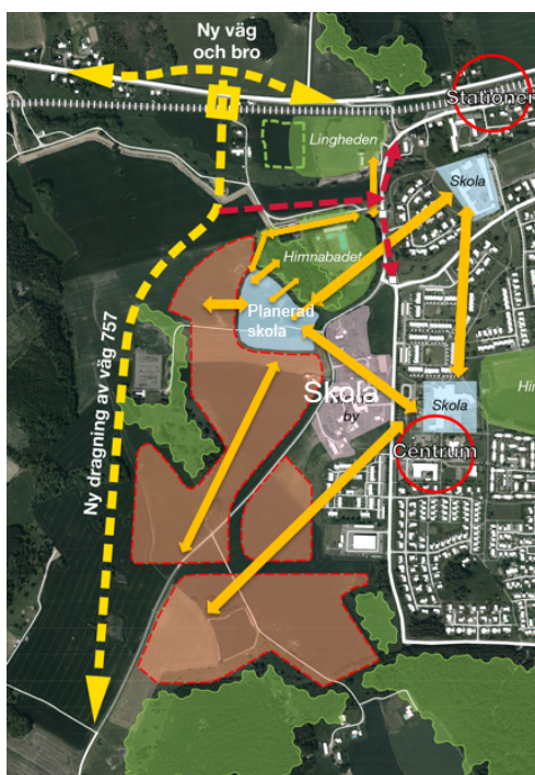
Bild 3: konfliktpunkter mellan trafik (röd) och oskyddade trafikanter (orange) med vägdragning enligt översiktsplan

En anslutning söderut från bron mellan exploateringen och Himnabadet skulle påverka flödena till och från den nya skolan. Dels mot Lingshemsskolan och eventuellt Himnaskolan, dels mot badet och dess grönområden samt mot Lingshems samhälle.