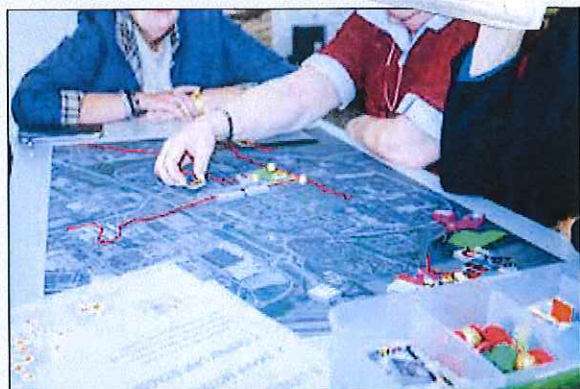
Bilder från tidigare medborgardialog i Skäggetorp våren 2016.