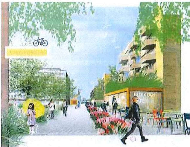
Visionsbild som visar nytt stråk förbi Skäggetorp centrum. Illustration Nyréns Arkitektkontor.

”Det viktigaste är att detta arbete leder till integration”