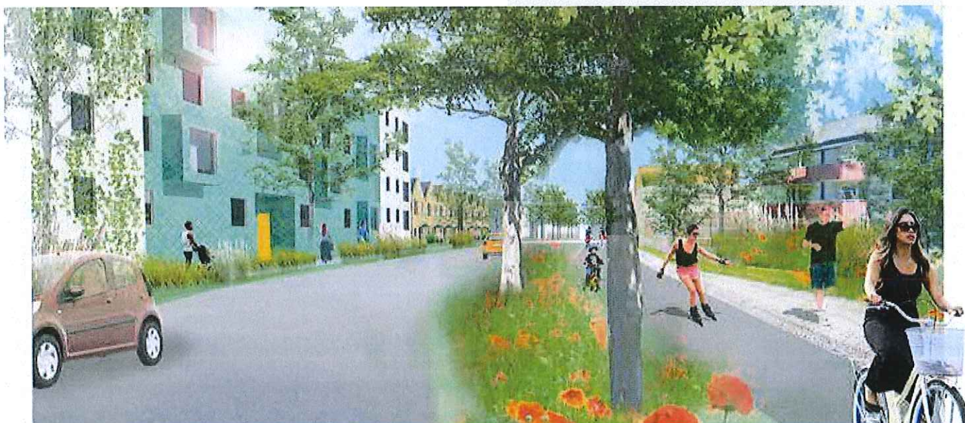
Visionsbild som visar Nygårdsvägens omvandling till stadsgata. Illustration Nyréns Arkitektkontor.