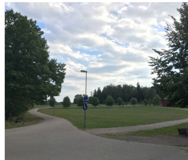
Till vänster: Stratontavägen från norr.