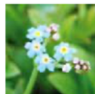
Myosotis sylvatica, skogsförgätmigej

Art nr: 2-10130 Färg: brunröd Blomning: maj-juli Höjd: 40 cm Utbredning: hela landet, ej fjällen Övrigt: föredrar fuktig- blöt jord