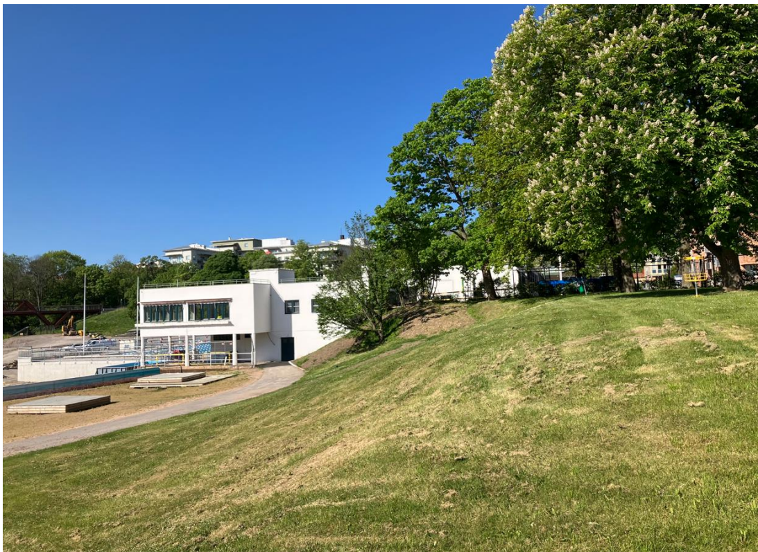
Aktuell yta där byggnation och åtgärder ska ske 2025 - 2026

Utifrån detta har Kultur- och fritidsförvaltningen utarbetat detta program för den yta som omfattas av Etapp 1 . Syftet med programmet är att tydliggöra vilket utbud badet ska ha och vilka funktioner det behöver innehålla för att fungera utifrån verksamhet, kundbehov och drift.