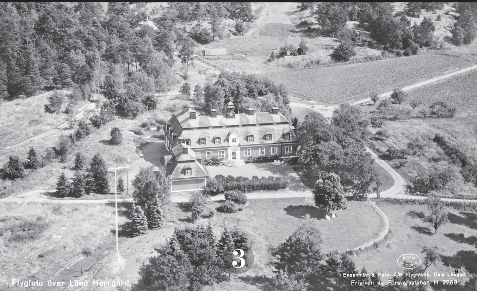
Flygfoto över Lönö Herrgård.