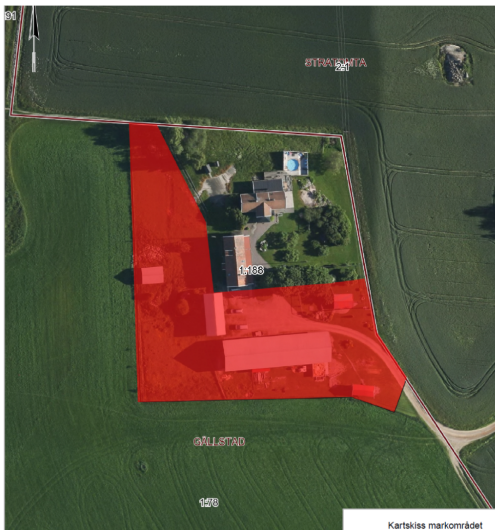
Figur 1 – Karta över östra Lingham med fastigheten och den aktuella delen markerad.