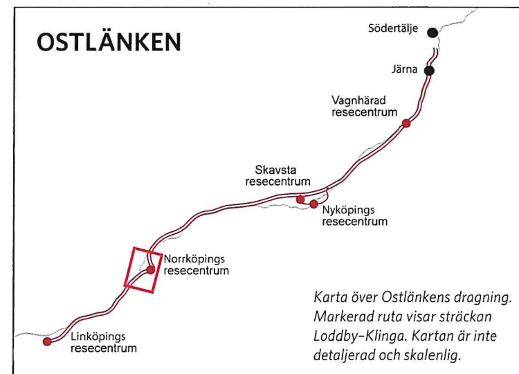
Karta över Ostlänkens dragning. Markerad ruta visar sträckan Loddby-Klinga. Kartan är inte detaljerad och skalenlig.