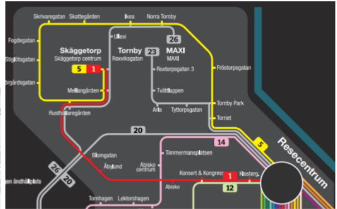
Platser: Skäggetorp centrum