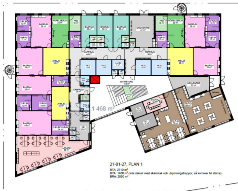
Bild 6 visar förslag på planlösning i nya huset.