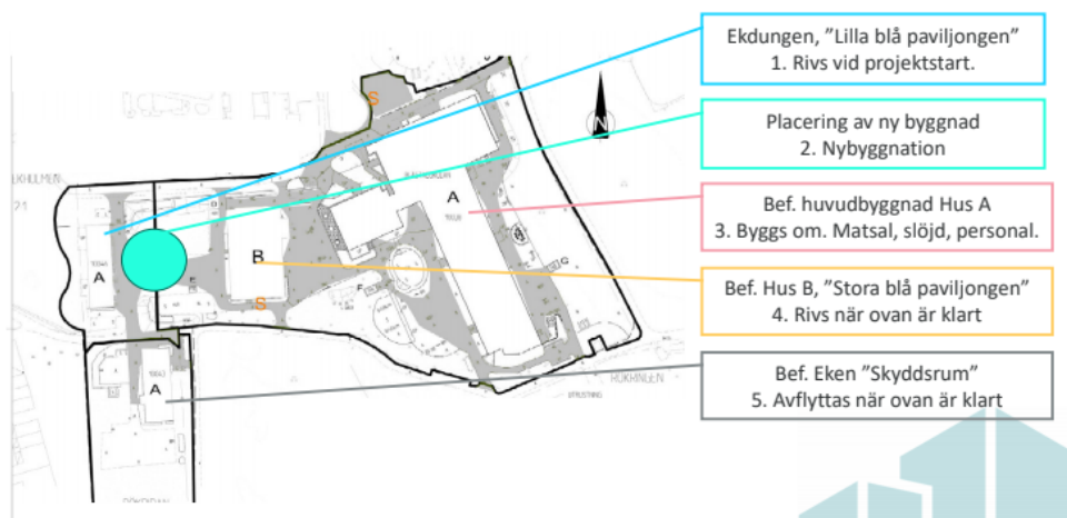
Bild 1 visar de befintliga byggnaderna och den ordning i vilken rivning och nybyggnation kommer att ske. I befintligt hus A kommer även en del ombyggnation att ske.

Den föreslagna om- och tillbyggnationen vid Blästadsskolan sker i mindre etapper enligt bild nedan. En paviljong, kallad "Lilla blå paviljongen" rivs redan vid projektstart. Evakuering av elever sker till lokaler i anslutning till Kvinnebyskolan. Evakueringen sker i totalt samråd med verksamheten. Inflyttning till de nya lokalerna sker till sommaren 2024 varvid ombyggnation av hus A kan ta vid. Matsal planeras byggas om under ett sommarlov för att störa verksamheten så lite som möjligt.