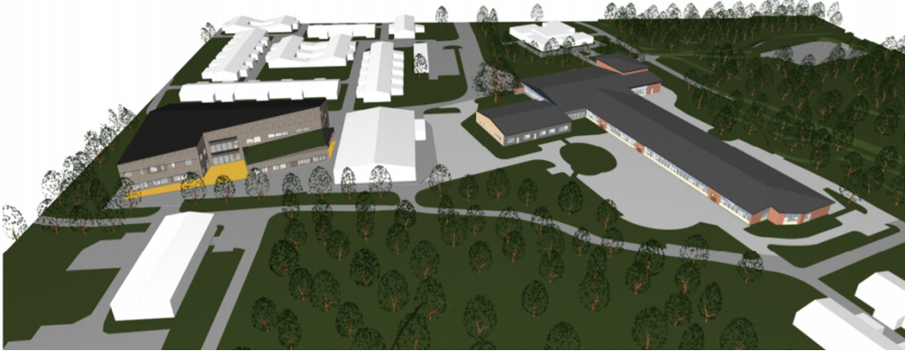
Bild 3 visar de befintliga byggnaderna och den första etappen av den nya byggnaden, med "Lilla blå paviljongen" rivna.