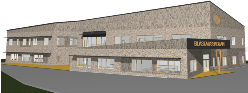
Bild 5 visar ett förslag på fasaden på den nya byggnaden.

Med reservation för att gestaltningen inte kommer att se ut som på bilden.