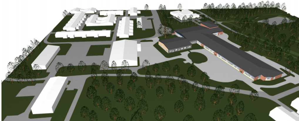
Bild 2 visar de befintliga byggnaderna. Den färgade byggnaden visar befintligt hus A. Det som byggdes om och till 2014.