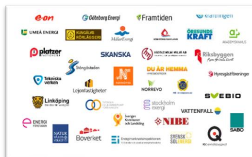
Figur 1 Finansiärer i Värmemarknad Sverige etapp 3