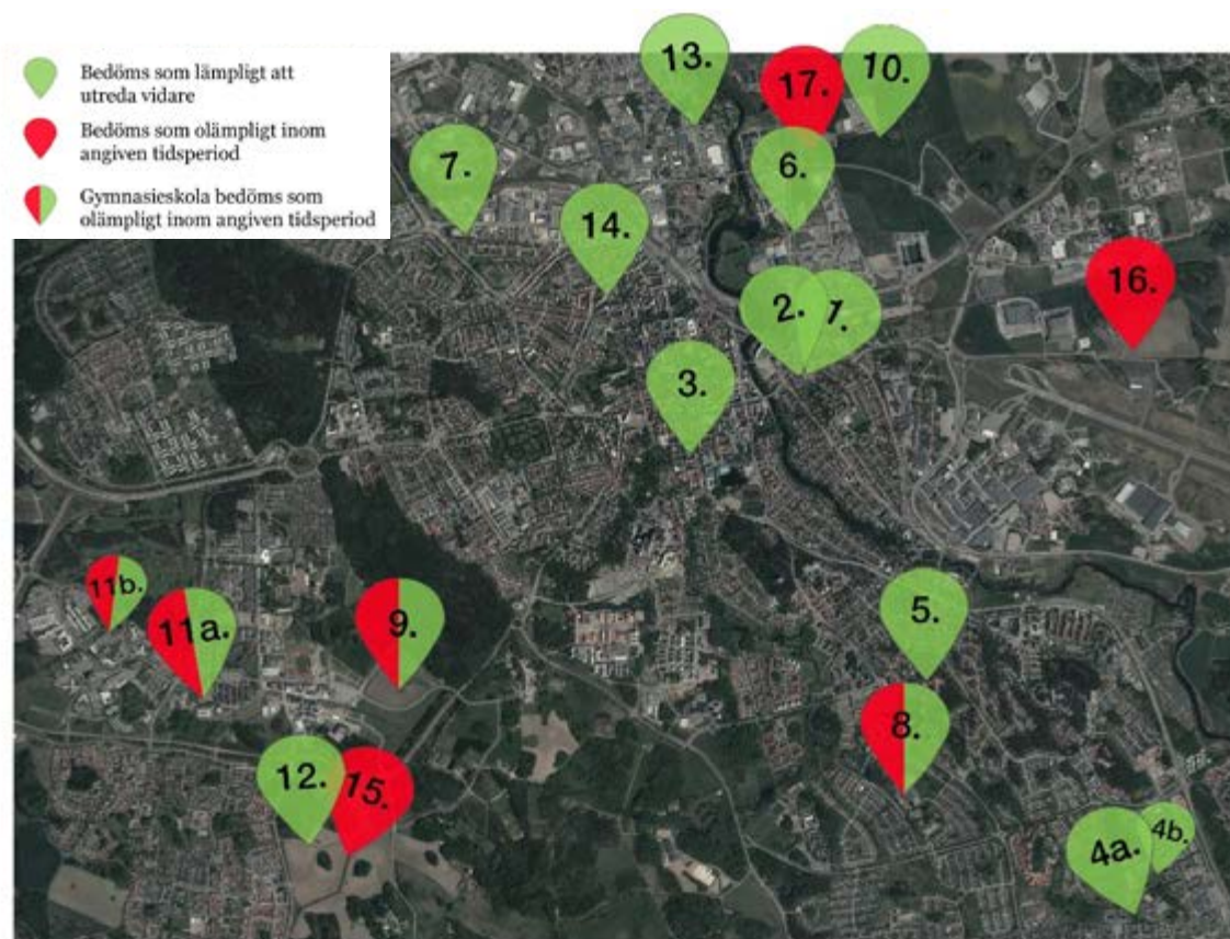
I kartan ovan sammanfattas resultatet av de utredda alternativen.