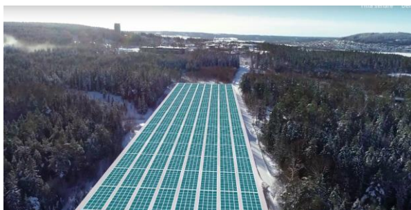
Östersund – 3,0 MW Beräknad invigning - dec 2019