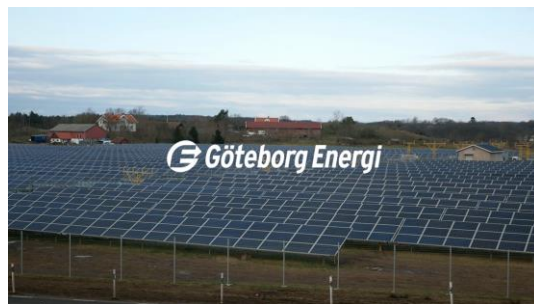
Göteborg – 5,5 MW Invigd - december 2018