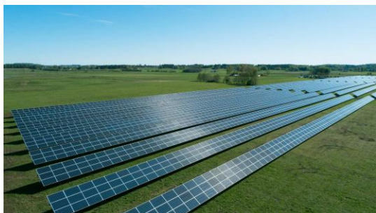
Sjöbo – 5,8 MW Invigd - sommaren 2019