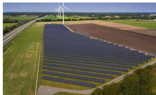
Varberg – 2,7 MW Invigd - september 2016