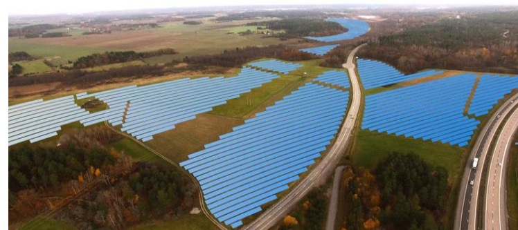
Strängnäs – 20 MW Beräknad invigning - dec 2020