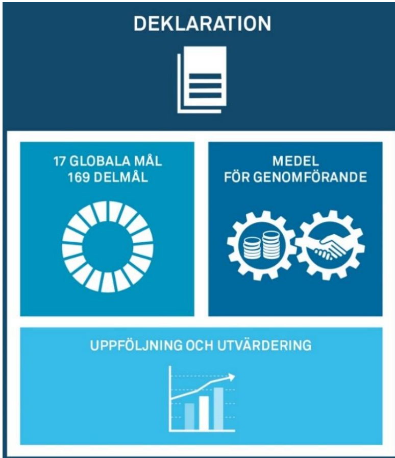
Figur 3.1 Agenda 2030 och dess beståndsdelar