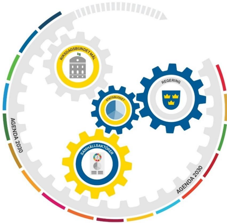
Figur 5.1 Ett riksdagsbundet mål för genomförandet av Agenda 2030

Ett mål för genomförandet av Agenda 2030 beslutat av riksdagen visar Sveriges åtagande på ett tydligt sätt och lägger grunden för systematisk uppföljning. Budgetprocessen är den årliga process som styr och inverkar på stora delar av den offentliga verksamheten. I statsbudgeten beslutas de ekonomiska ramarna samt inriktningen för främst statsförvaltningens arbete, vilket även påverkar andra samhällsaktörer.