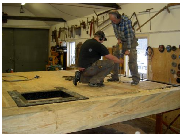
Nyttillverkning i verkstaden i Hovetorp.