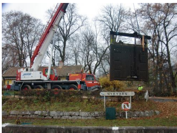
Lyft av port i Nykvarns sluss.

I arbetet ingår att portarna lyfts och detaljer som ska återanvändas monteras bort i bolagets verkstad. Därefter tar nybyggnationen vid och de nya slussportarna återmonteras inför nästa års säsong.