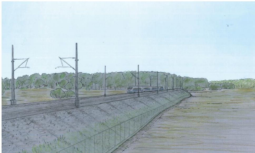
Figur 6. Illustration av skalenlig VR-modell - Stängsel vid bank (Ingun Platell, WSP 2017)

Vid de passager/höjdområden där järnvägen går i skärning placeras stängsel intill bergskärningen, i ett högt läge. Eftersom höjdområden generellt är skogbeksädda, döljer vegetationen till stor del den visuella påverkan som järnvägens stängsel innebär på höjdområden (figur 7).