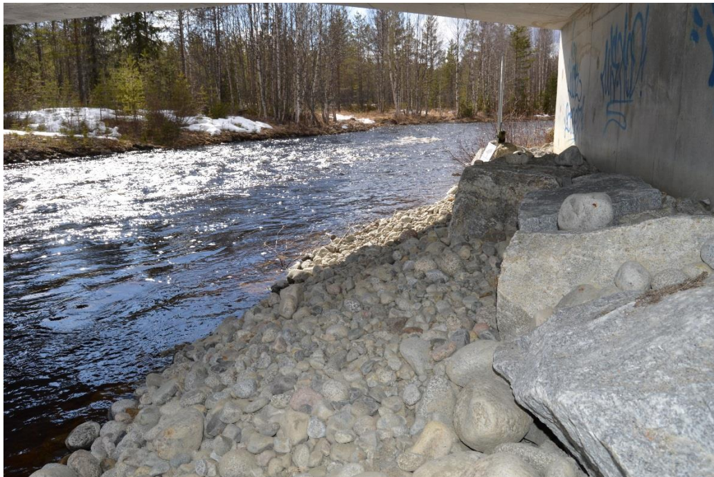
Figur 2. Exempel på strandpassage för landlevande djur.

Var och hur viltpassager och passager för de människor som använder landskapet ska lokaliseras och utformas, är viktiga frågor att arbeta vidare med i den fortsatta planeringen. I detta arbete finns möjlighet att kombinera åtgärder för att stärka ekologiska och sociala samband genom att rörlighet för vilt och/eller människor bibehålls. Viltpassager kan utformas som viltportar under järnvägen eller som ekodukter över anläggningen.