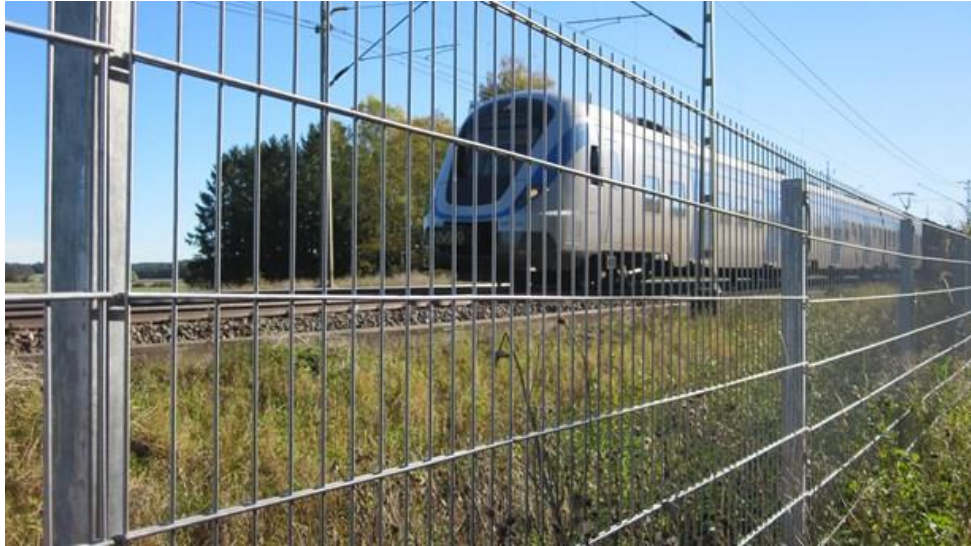
Figur 5. Exempel på robust järnvägsstängsel.