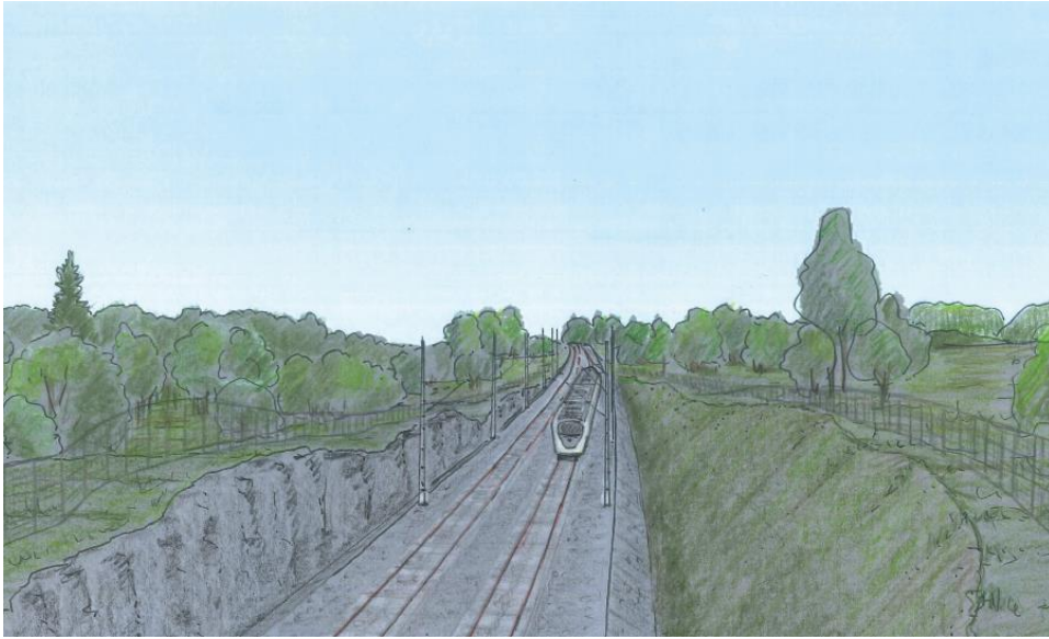
Figur 7. Illustration skalenlig VR-modell - Stängsel vid skärning (Ingunn Platell, WSP 2017)