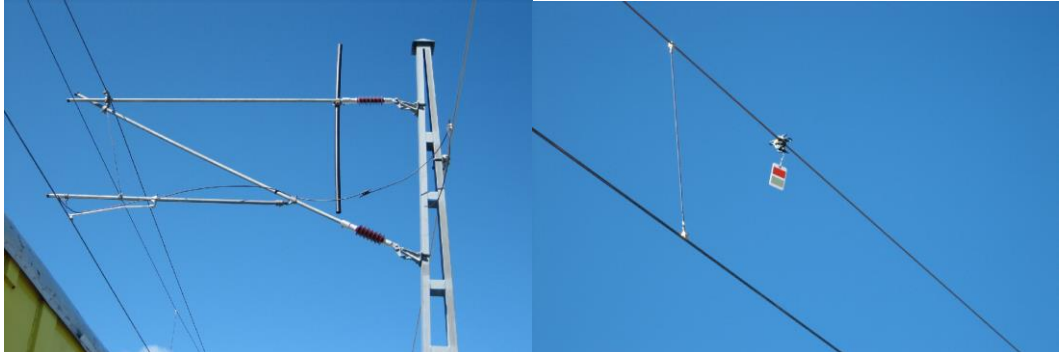
Figur 4. Exempel på åtgärd som sätts upp i områden där stora fåglar och rovfåglar kan ha sina revir, jaktmarker osv. Syftet med pinnen (bild 1) är att förhindra att fåglar med stort vingspann sätter sig för nära stolpe/strömförande ledning. Typ av reflektor (bild 2) som rör sig i vinden som gör fåglarna uppmärksamma på att det finns hinder.

Vid fågelrika områden anpassas även anläggningen med fågelavvisare, d.v.s. åtgärder som förhindrar att fåglar kommer i kontakt med strömförande delar/kontaktledningen (figur 4). Anpassning med riktade åtgärder ska även utföras vid identifierade konfliktsträckor i områden med fladdermöss.