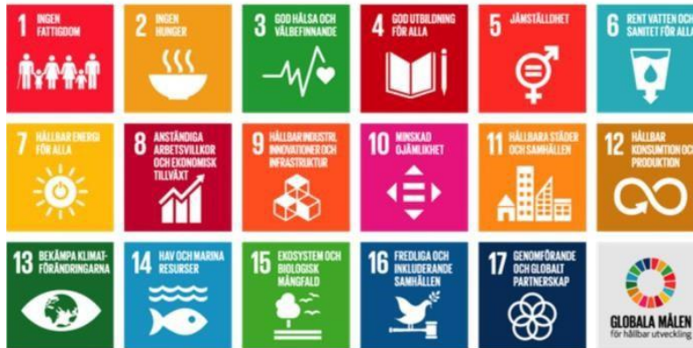
Figur 1. De globala målen

Vid FN:s toppmöte den 25 september 2015 antog världens stats- och regeringschefer 17 globala mål och Agenda 2030 för hållbar utveckling.