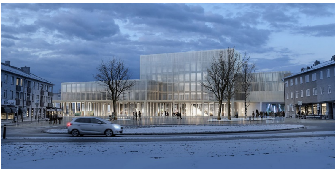
Det vinnande arkitektbidraget "Laterna Magica", ritat av Arkitema.

I juni 2017, § 325, informerades kommunstyrelsen av om det vinnande förslaget i arkitekttävlingen, "Laterna Magica".