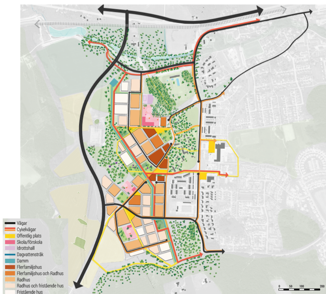
Figur 2. Förslag till strukturskiss (Mandaworks)

Trafikstrukturen i området bygger vidare på Linghems befintliga trafiksystem där gång- och cykeltrafik premieras. Linghems befintliga centrala, bilfria och gröna kärnan, som sträcker sig i östvästlig riktning, ska även sträcka sig vidare in i det nya området Himna. Kopplingen är viktig mellan befintligt centrum i Linghem och möjligheterna för en ny offentlig plats med offentliga lokaler och service i Himna.