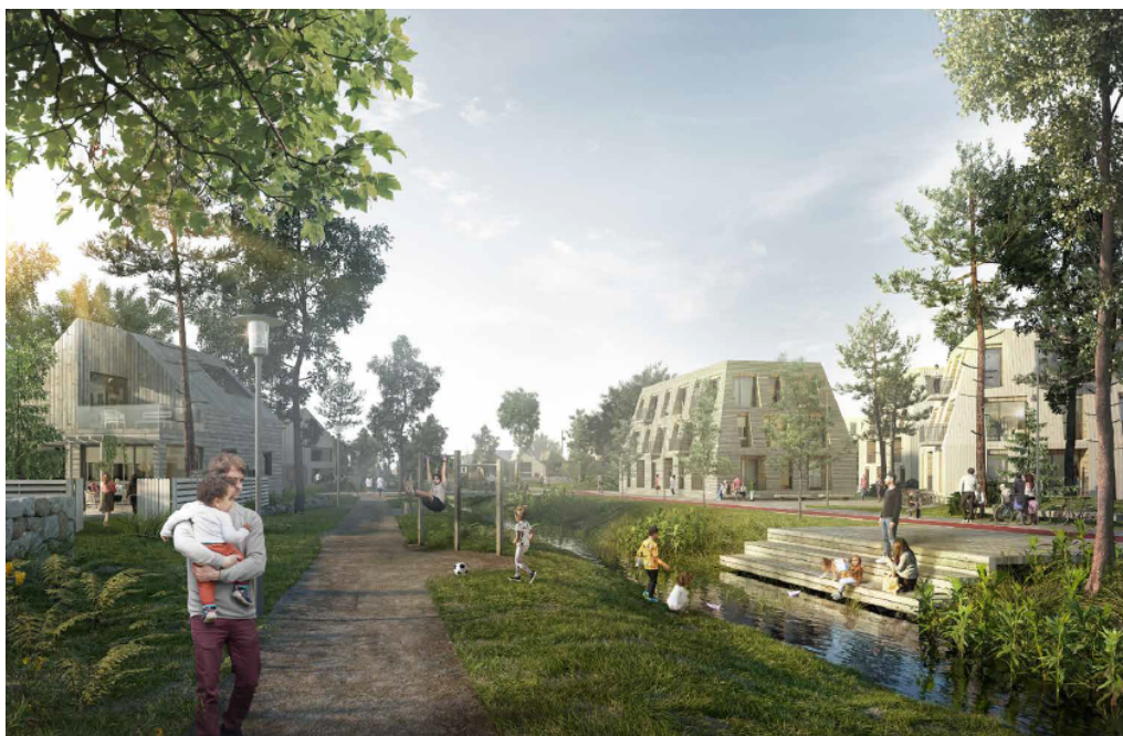
Figur 3. Visionsbild över områdets befintliga lågstråk som föreslås omvandlas till ett expresscykelstråk, grönstråk som skall användas för dagvattenhantering och översvämning vid höga flöden (Mandaworks)